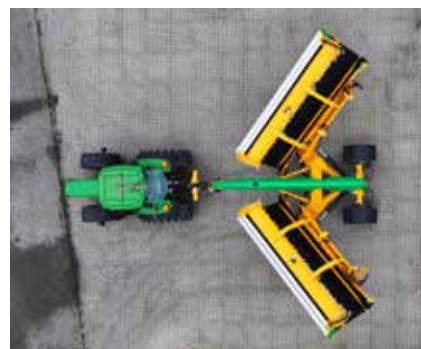
Machine dépliée à 50%