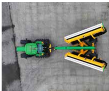
Machine dépliée à 25%