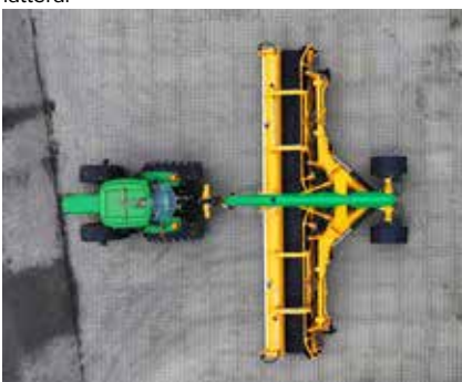
Machine dépliée à 100% en position andain latéral