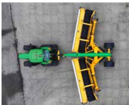
Machine dépliée à 75%